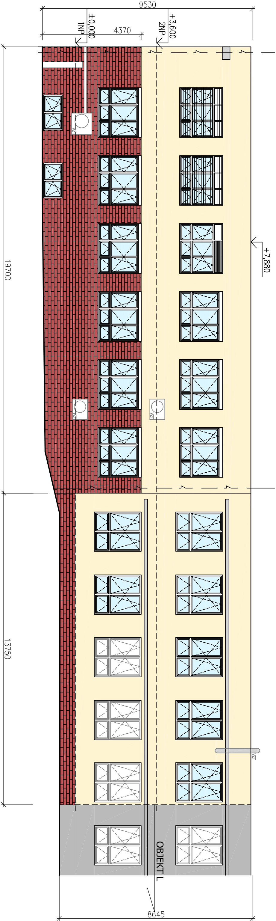
POHLED 1 - NOVÝ STAV